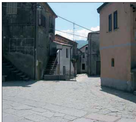
di CLAUDIO CAVALIERE

Una sorta di ombelico del mondo I torresi sono al minimo storico 1.174