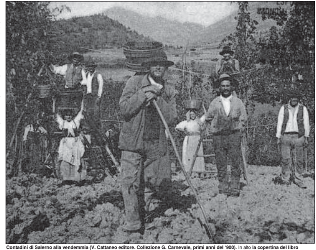
Contadini di Salerno alla vendemmia (V. Cattaneo editore. Collezione G. Carnevale, primi anni del '900. In alto la copertina del libro

L'italiano del Sud è stato sempre considerato quasi come carne da cannone (vi prego di notare il "quasi"). Nella prima guerra mondiale è stato il contadino meridionale che ha dato la massa dei combattenti di prima linea, mentre l'operaio del Nord poteva imboscarsi nelle officine o nelle armi privilegiate, oppure, sapendo leggere e scrivere, negli uffici dove si organizzava tutto quello che occorreva per mandare gli altri a morire (...). Sotto il Fascismo poi la politica autarchica nelle industrie era tutta a vantaggio del Nord, mentre quella agraria, danneggiava, per la natura della produzione, la maggior parte delle regioni meridionali (...). Tornando a parlare dell'impegno dei meridionali nella guerra, trovo che Mussolini venne la prima (e l'ultima) volta in Calabria solo alla vigilia della dichiarazione di guerra. Prima non aveva avuto tempo. Venne in treno e fece di tutto per scappare al più presto possibile, prima che, pur attraverso le bugie ufficiali, gli arrivasse qualcosa all'orecchio delle miserabili condizioni in cui viveva il popolo (...). Il meridionale, ad eccezione parzialmente dei Siciliani e dei Napoletani, non ha molto sviluppato il talento pratico ed organizzativo dei nordici (...).